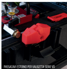
PASSACAVI ESTERNO PER VALIGETTA SERIE VO