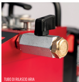
TUBO DI RILASCIO ARIA