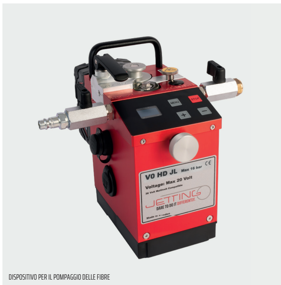
DISPOSITIVO PER IL POMPAGGIO DELLE FIBRE