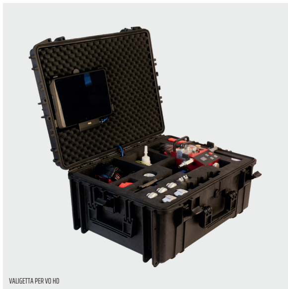
VALIGETTA PER VO HD