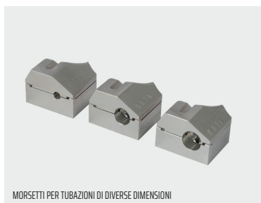
MORSETTI PER TUBAZIONI DI DIVERSE DIMENSIONI